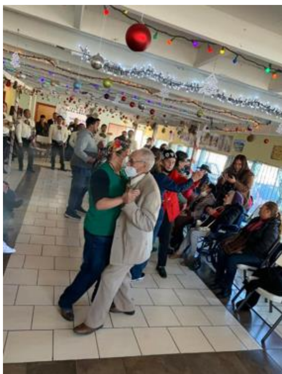
Captura por: Tania S. Tijuana, 2022.

A través del siguiente ejemplo, lo que se quiere demostrar es que la conflictividad inherente a las acciones y responsabilidades de cuidados son parte del cómo se viven las relaciones de trabajo de cuidados en este contexto. Asimismo, este ejemplo es parte de una reflexión más amplia que permite explicar la forma en la que experiencias relacionadas con el abandono, uno que se da particularmente por el retorno de los mayores de una ciudad fronteriza a otra, sirven para poder explicar los modelos de cuidados en la ciudad.