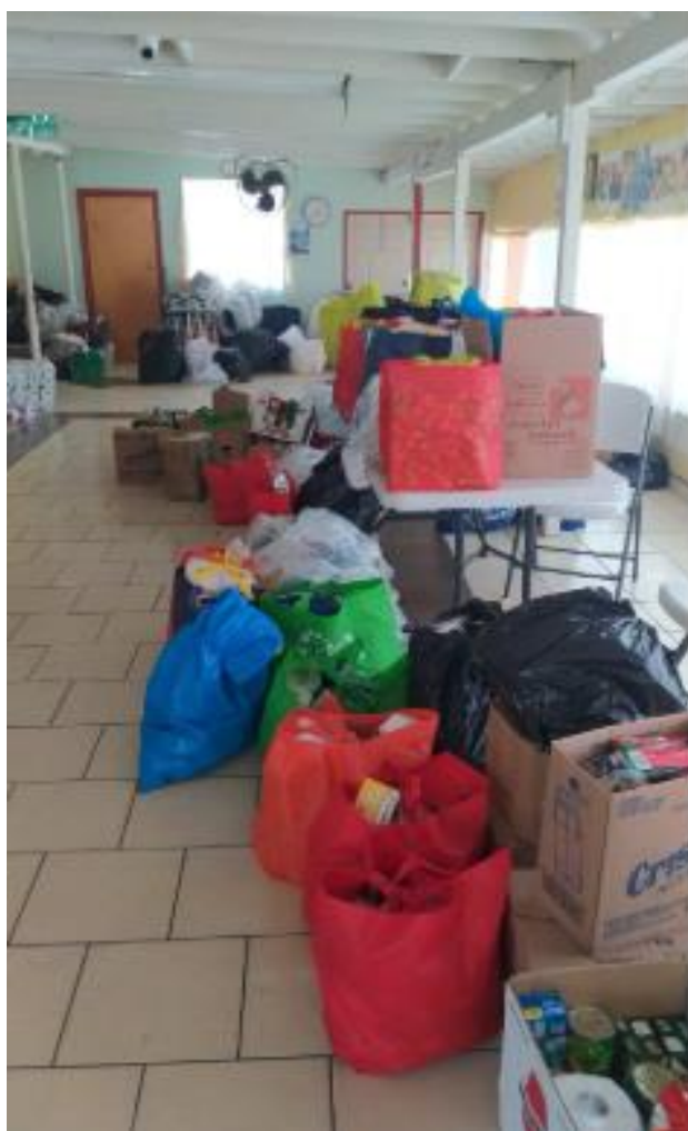
Foto 4.1 Día de recaudación y clasificación de insumos

En esta sintonía, el trabajo de cuidados en esta casa lograba franquear los retos del cuestionamiento del cuidado familiar, en la que se entablaban negociaciones y límites al respecto de los cuidados brindados en la casa. Además de posicionar al cuidado más allá de los intereses del mercado, aún así, el cansancio y el complicado “empate” de actividades, tiempos y lugares en la vida de las cuidadoras era un tema recurrente.