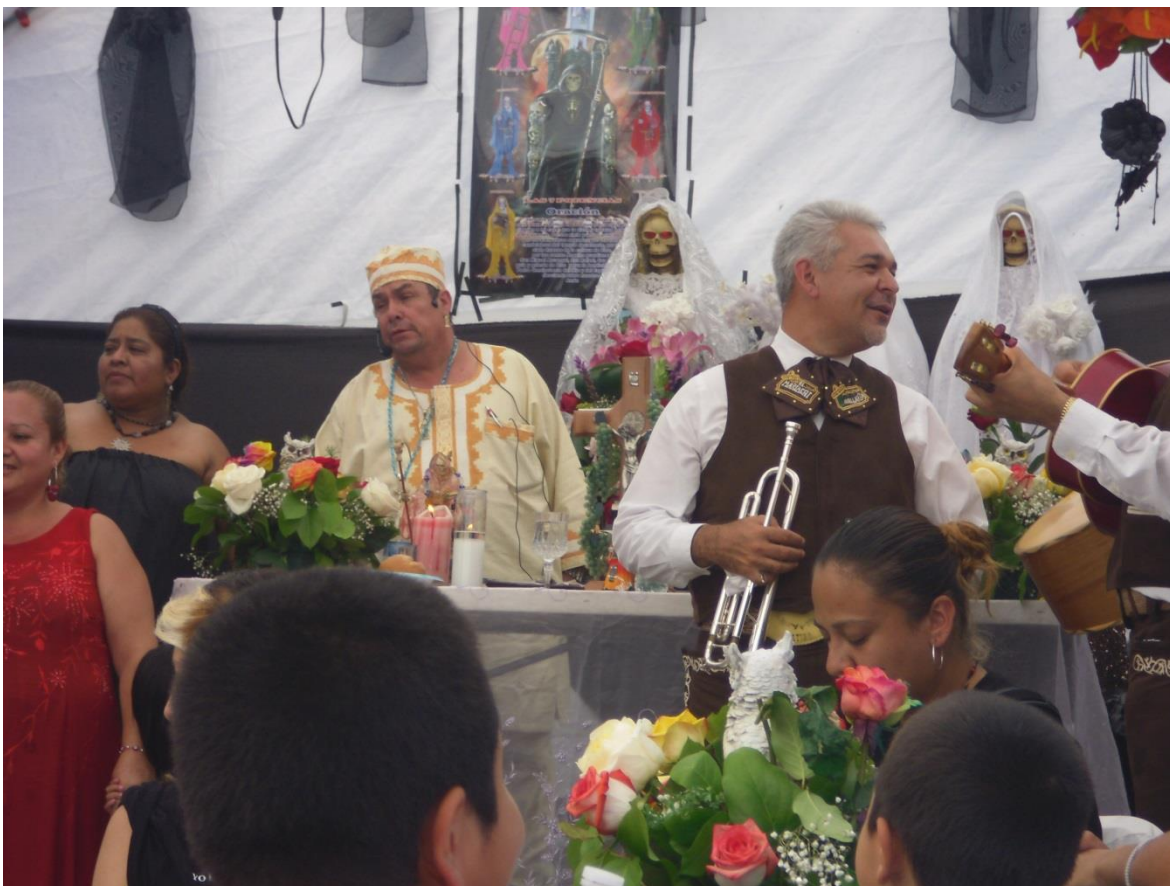
Imagen 17. Celebración anual del Templo Santa Muerte. Los Ángeles, California, Estados Unidos