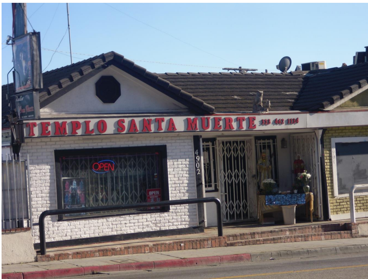
Imagen 21. Templo Santa Muerte, Los Ángeles, California, Estados Unidos.