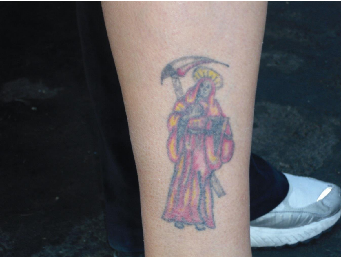
Imagen 11. Tatuaje de la Santa Muerte en la pierna de una mujer

Fuente: fotografía propia, 1 de enero de 2013. Altar de Alfarería, Colonia Morelos, Ciudad de México