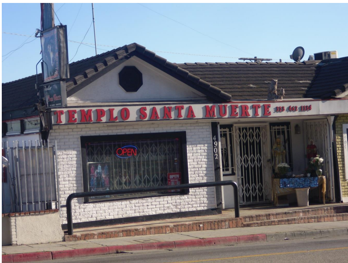
Imagen 6. Templo Santa Muerte en Los Ángeles, California.