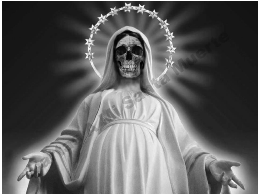
Imagen 22. Imagen de la Santa Muerte en internet

es para el amor, el blanco para la salud y la paz, mientras que el negro se utiliza para mayor protección o para rituales de magia negra. La Santa Muerte del cartel, que aparece sentada en un trono, tiene una guadaña en la mano izquierda, al igual que una de las figuras de la mesa, este instrumento para la agricultura se asocia con el fin de la vida. Finalmente, la balanza simboliza la capacidad que tiene la Santa Muerte para hacer justicia.