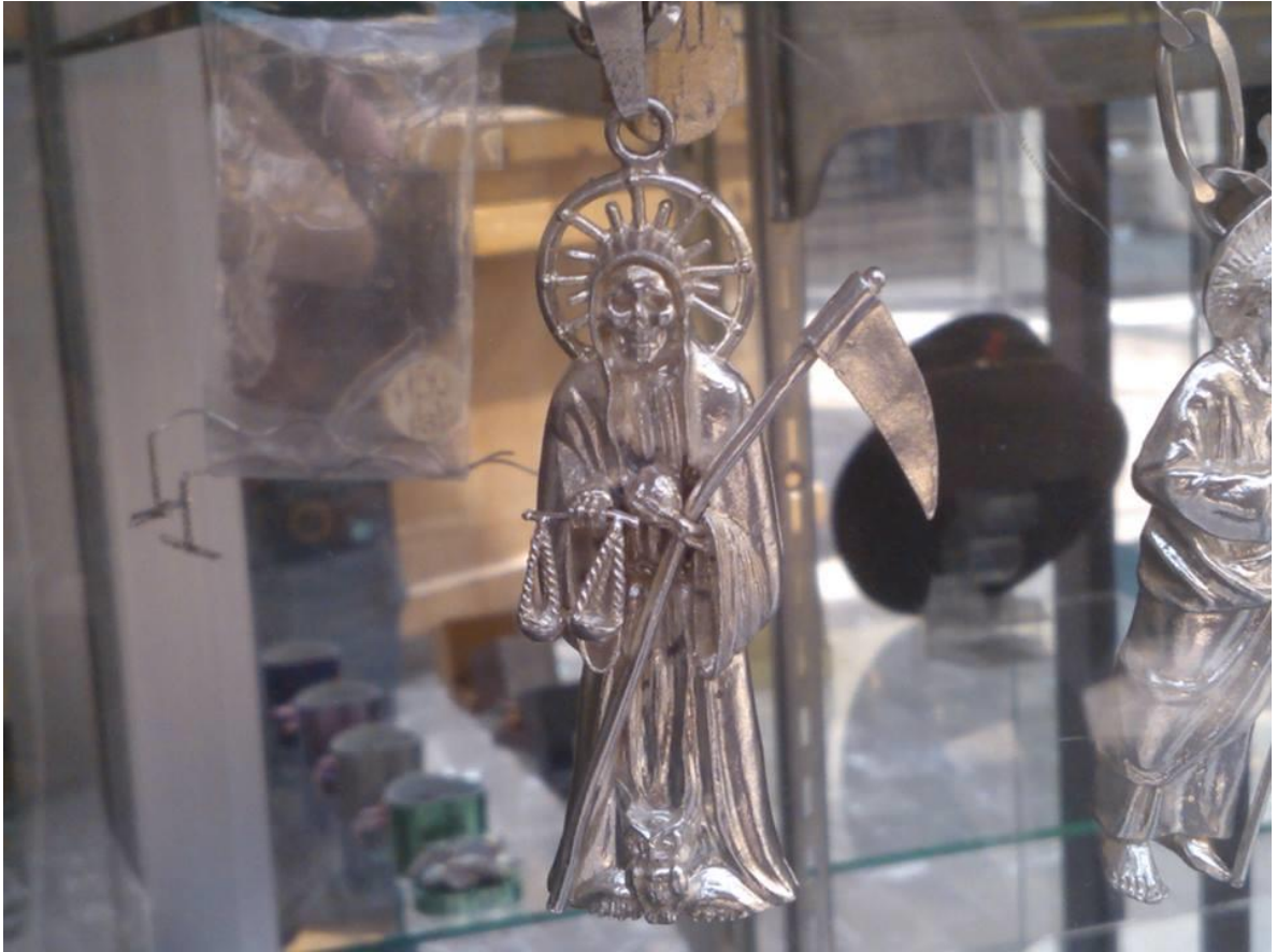
Imagen 16. Dije de la Santa Muerte elaborado en plata. Casa de empeño en Tijuana

Casa de empeño en Tijuana, Baja California. 2014