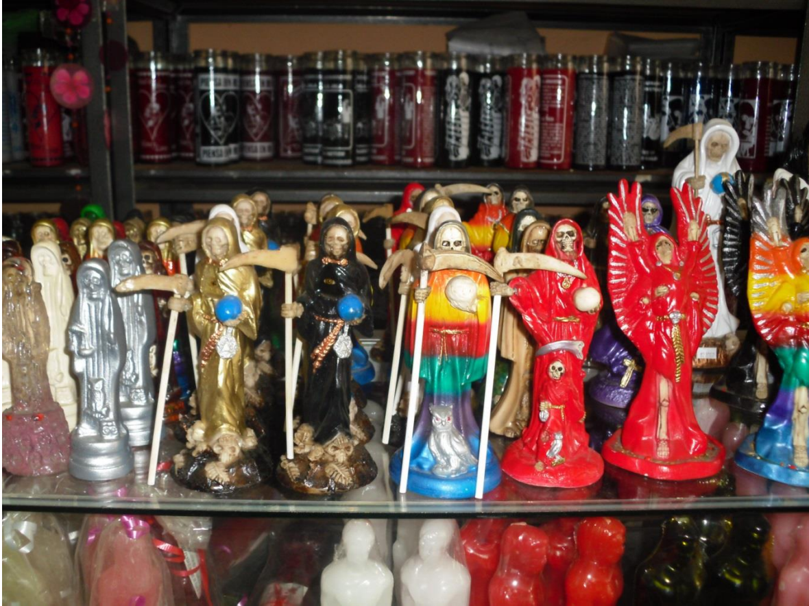
Imagen 13. Figuras de la Santa Muerte en venta en Tijuana

Centro de Tijuana, Baja California, México. 2013