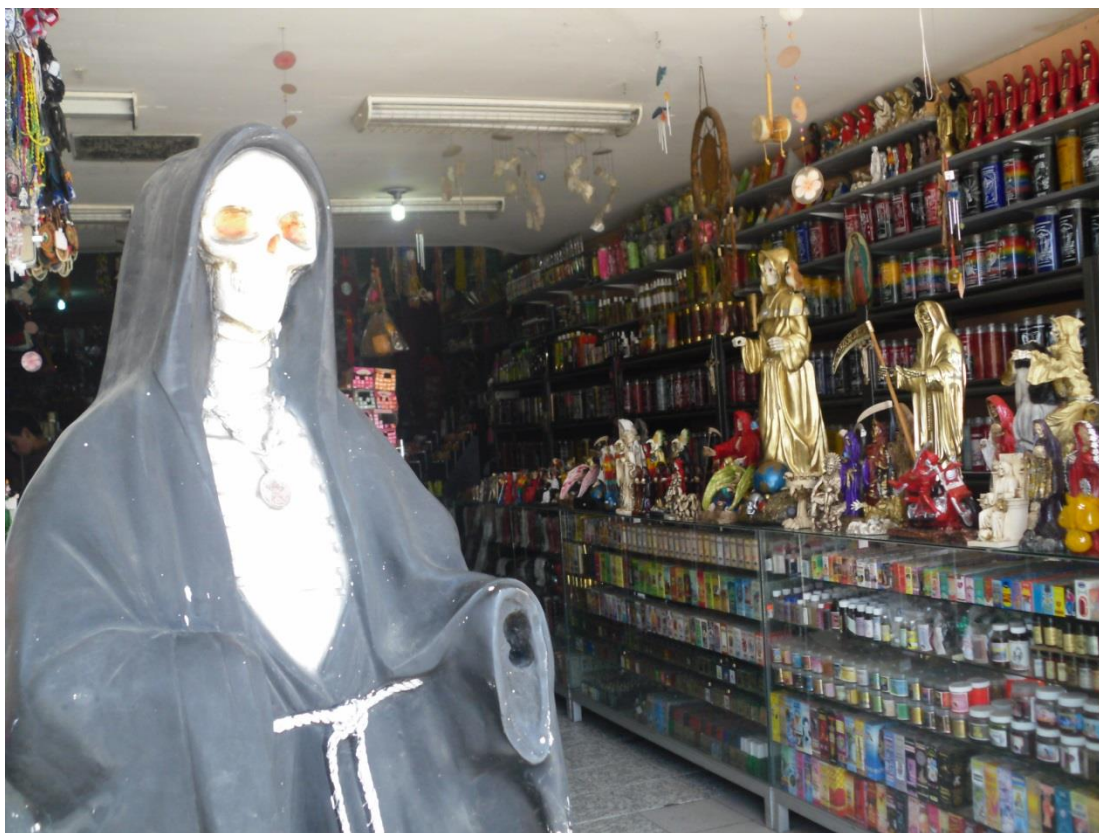
Imagen 5. Tienda botánica y esotérica en el centro de Tijuana.

Jesús Malverde y Juan Soldado. La figura “milagrosa” principal de estos comercios es la Santa Muerte y es sencillo adquirir sus imágenes en diversos materiales –papel corrugado, plástico, madera, cerámica- o en carteles, tarjetas, escapularios y veladoras. Las figuras pueden medir apenas unos centímetros o llegar a tener una altura de hasta diez metros, por supuesto con variación de precios.