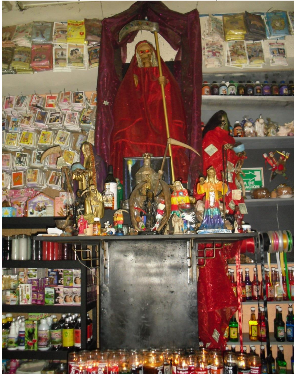
Imagen 12. Tienda esotérica en el centro de Tijuana

Fuente: fotografía propia, Centro de Tijuana, Baja California, México. 2013