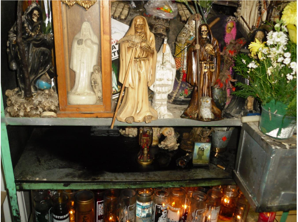
Imagen 15. Altar a la Santa Muerte dentro del mercado “el Popo”, Tijuana, Baja California

Centro de Tijuana, Baja California, México. 2013