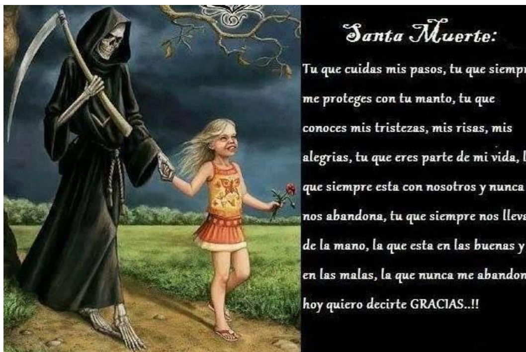
Imagen 3. La Santa Muerte en las redes sociales