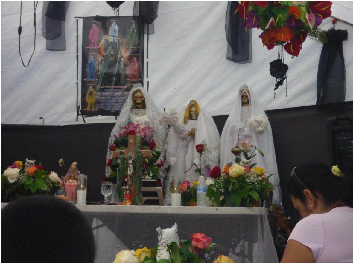
Imagen 18. Figuras en el Templo Santa Muerte. Los Ángeles, California

centro de la imagen son representadas como esqueletos de pie con vestidos blancos, como las vírgenes marianas y, de acuerdo con el testimonio de Sahara, simbolizan pureza.