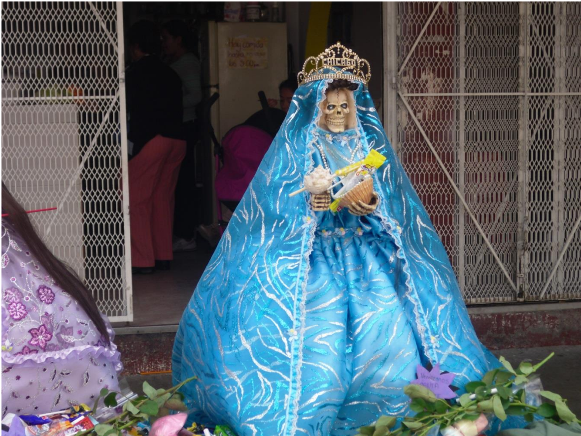
Imagen 8. Imagen coronada de la Santa Muerte.

1 de agosto de 2013. Altar de Alfarería, Colonia Morelos, Ciudad de México