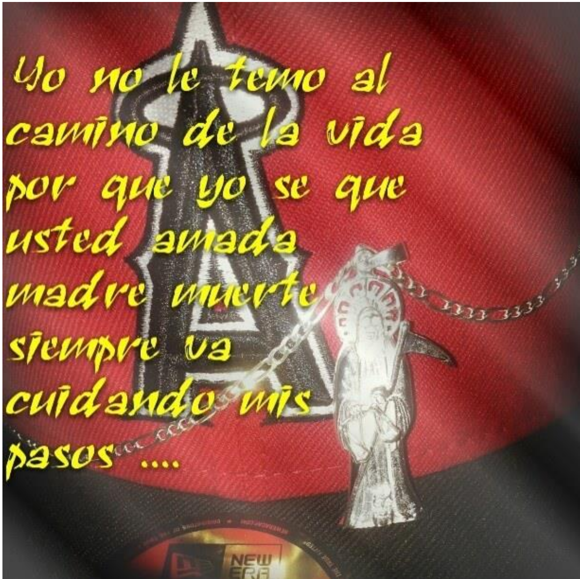
Imagen 23. Imagen elaborada por devoto de la Santa Muerte.