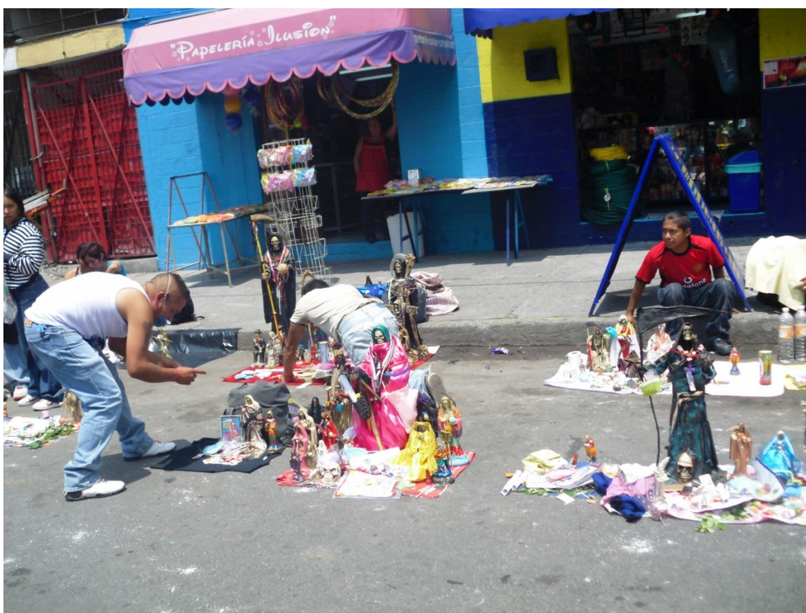
Fuente: fotografía propia, 1 de agosto de 2013. Altar de Alfarería, Colonia Morelos, Ciudad de México