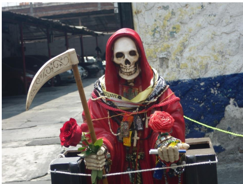
Imagen 9. Santa Muerte con guadaña y rosas

Para complementar el análisis iconográfico previo, se ha elegido una fotografía por cada uno de los tres lugares de investigación y una fotografía obtenida de la red social Facebook.com, con la finalidad de analizarlas basándonos en cada uno de los niveles propuestos por Erwin Panofsky (preiconográfico, iconográfico e iconológico) y, de esta manera, saber si se obtiene información importante al comparar los resultados.