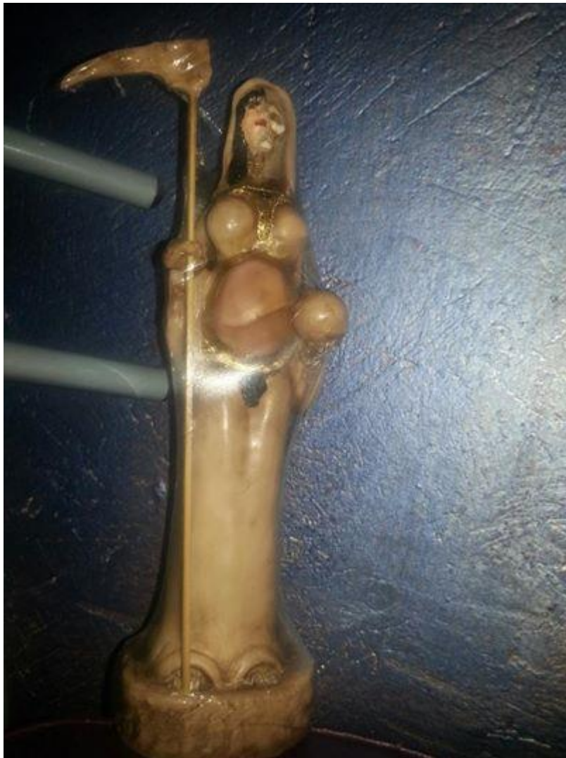
Imagen 24. Figura de la Santa Muerte embarazada

generalmente le hace compañía. La gorra y el dije con la cadena son dos objetos de gran valor sentimental para la persona que elaboró la fotografía y que muestran preferencias deportivas y creencias religiosas.