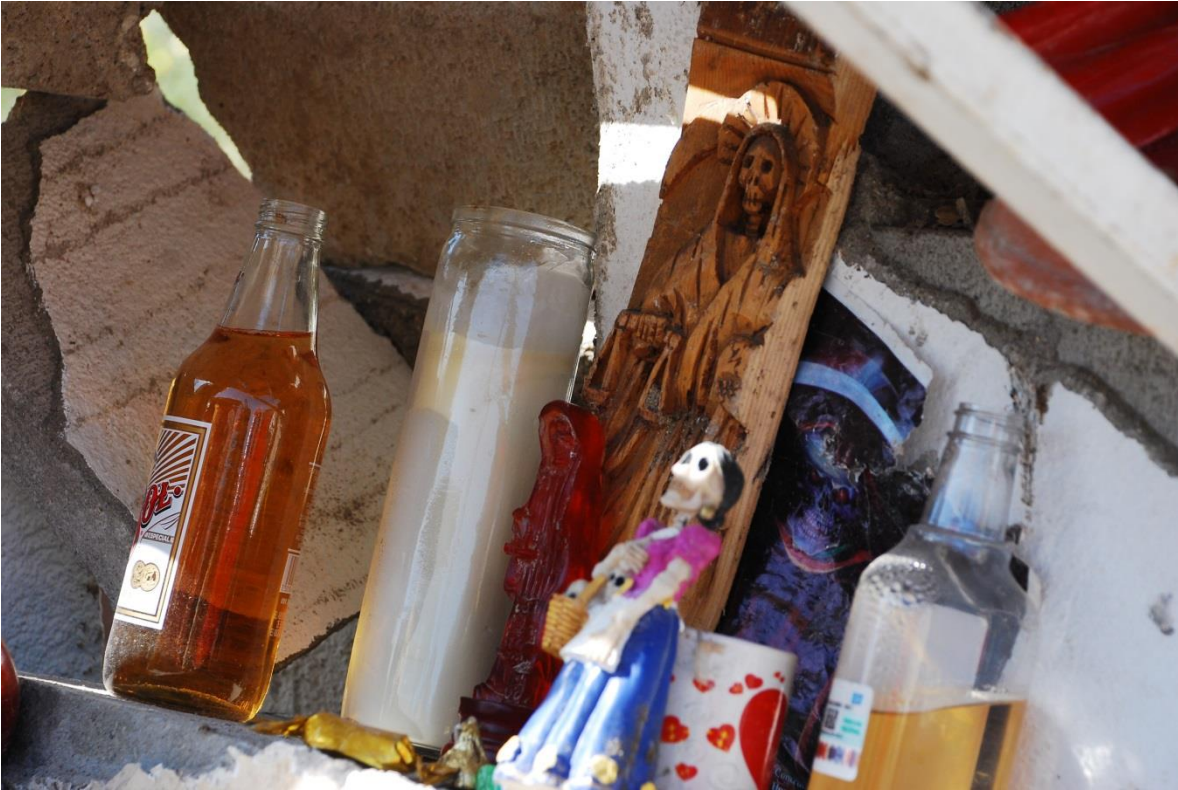
Imagen 14. Capilla de la Santa Muerte destruida en Tijuana, Baja California

Fuente: Fotografía de Joana Alejandra Dávila Medellín. Archivo del Colegio de la Frontera Norte. 2009