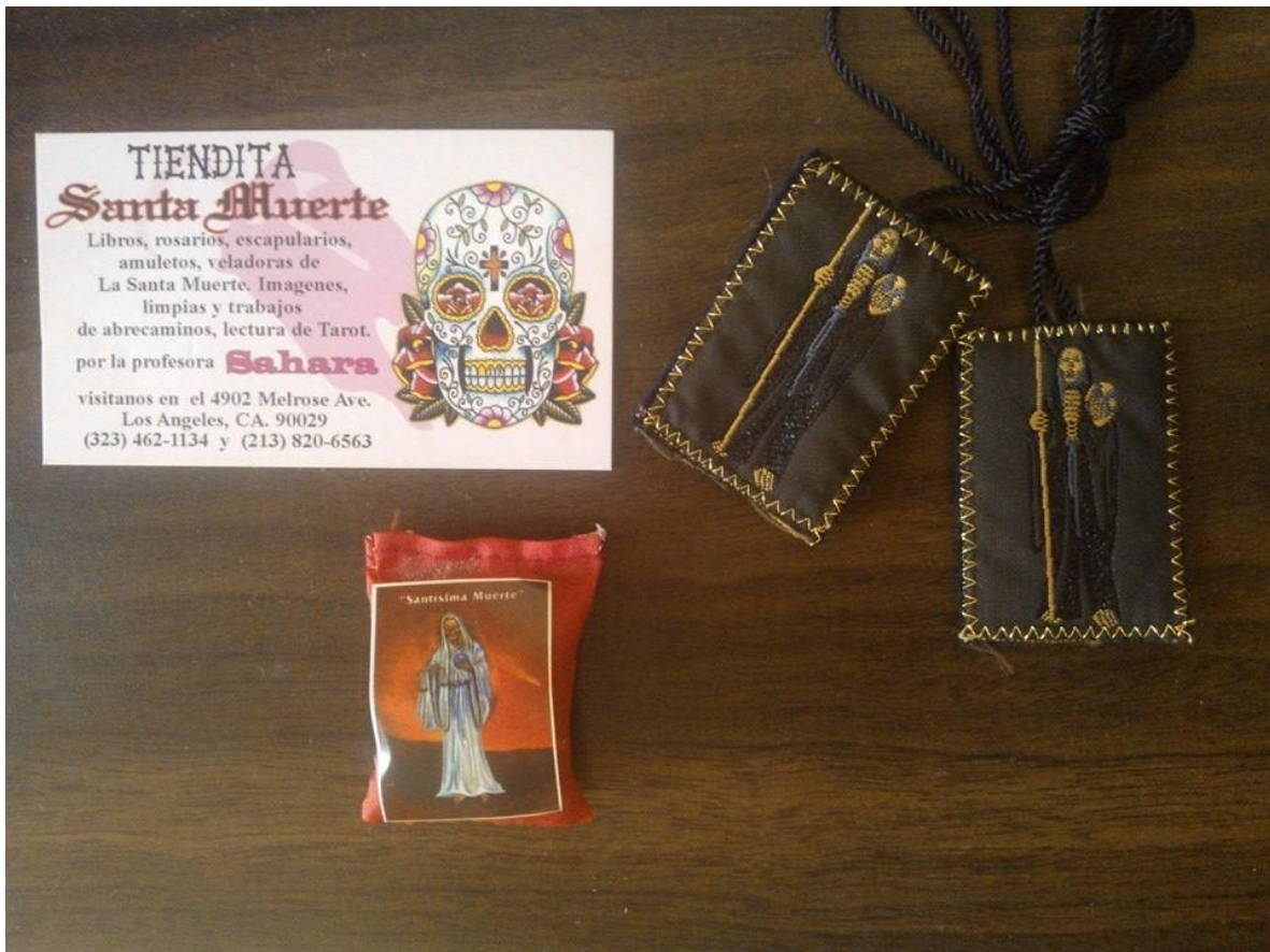
Imagen 20. Objetos etnográficos recolectados en el Templo Santa Muerte, Los Ángeles