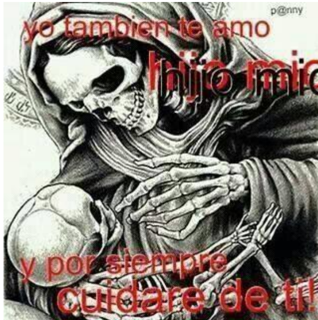
Imagen 25. Imagen maternal de la Santa Muerte