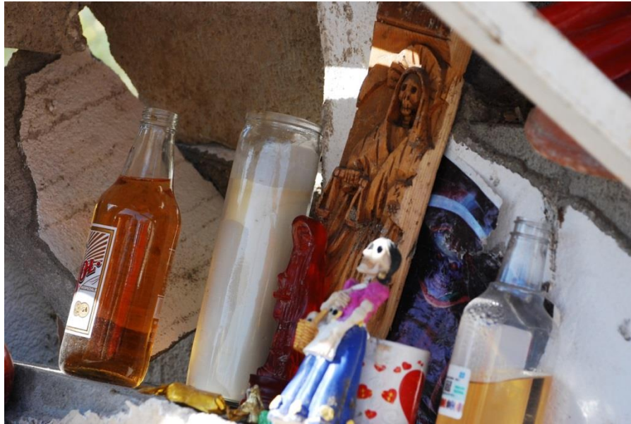
Imagen 14. Capilla de la Santa Muerte destruida en Tijuana, Baja California

Fuente: Fotografía de Joana Alejandra Dávila Medellín. Archivo del Colegio de la Frontera Norte. 2009