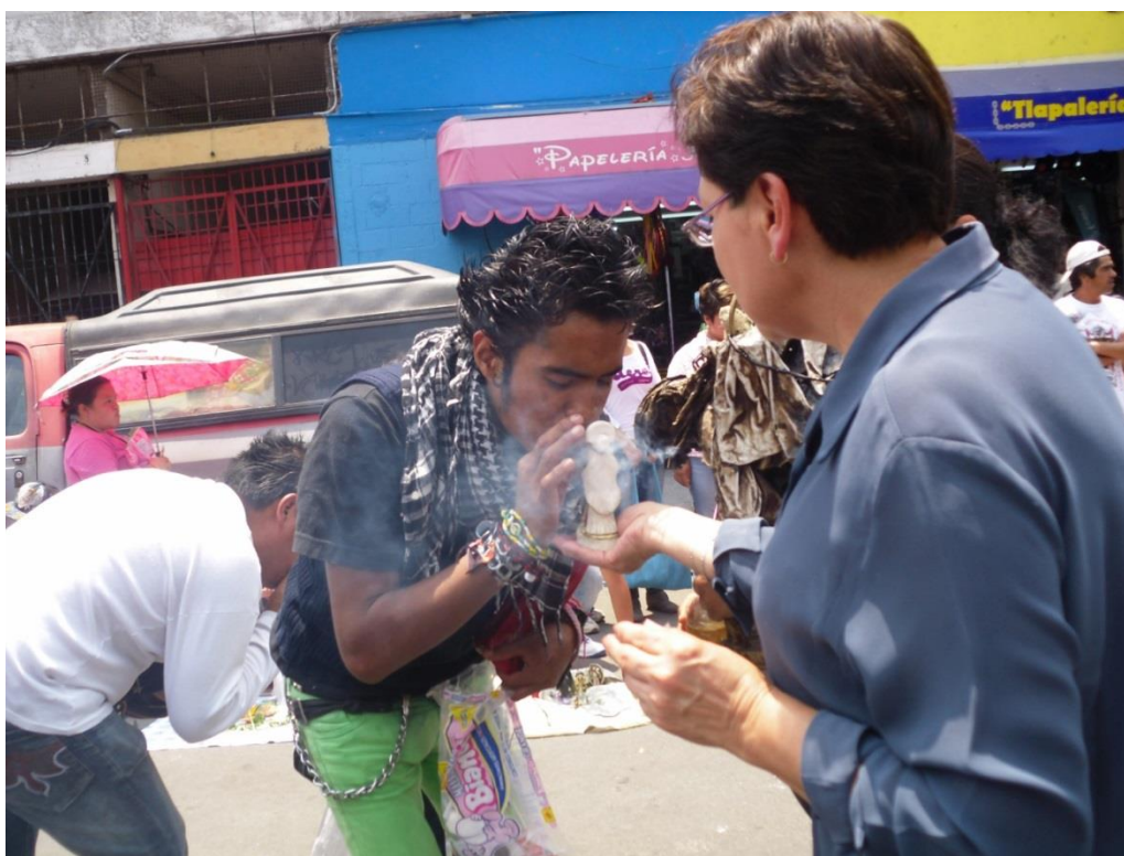
Fotografía propia, 2013

Existen altares públicos y privados edificados en honor a esta figura que constituyen espacios sagrados dentro de la devoción y que pueden tener una o varias figuras de la Santa Muerte de diferentes tamaños. Katia Perdigón propone cuatro tipos de altares fijos: 1. Altares caseros, 2. Altar de iniciados, 3. Altar de curanderos, y 4. Narcoaltares (2008: 83). Cada uno de estos espacios cuenta con elementos provistos de significados específicos para los creyentes. Un