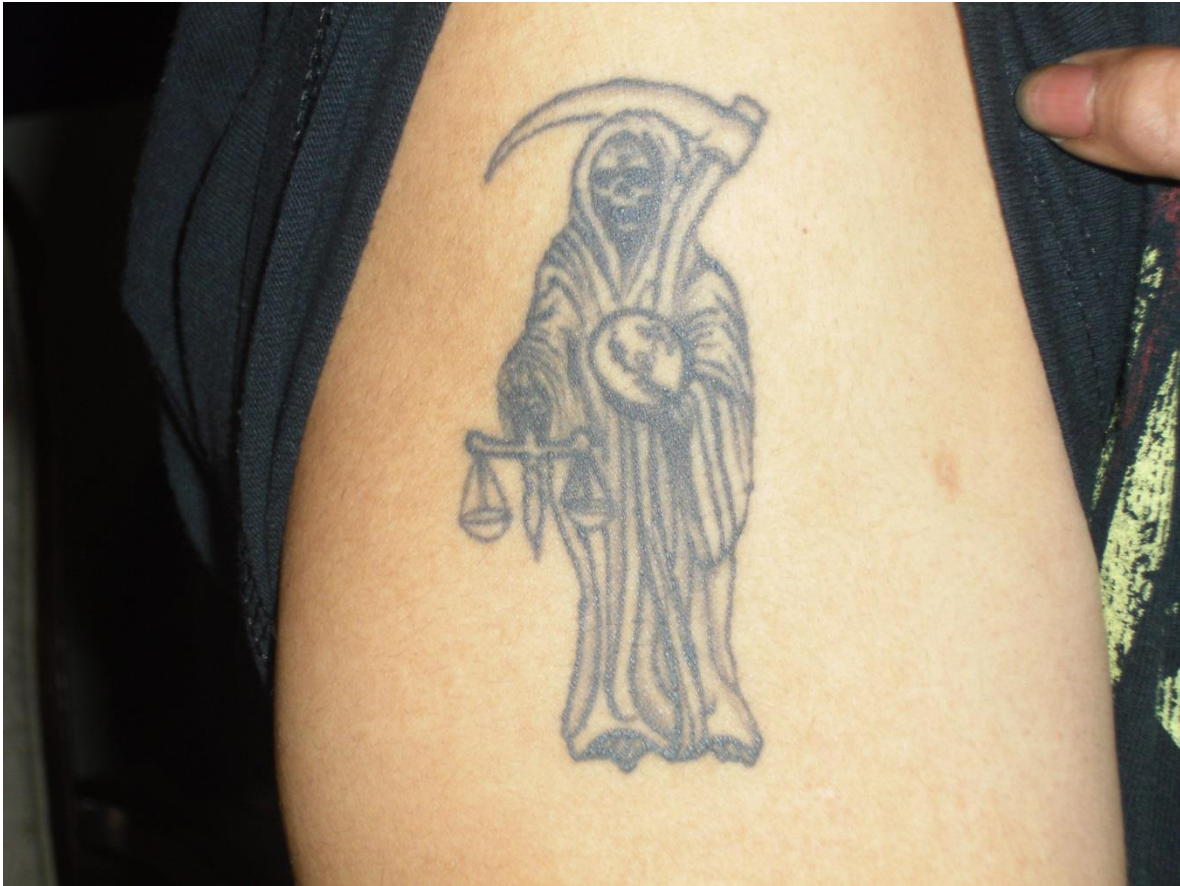
Imagen 19. Tatuaje en el brazo de un líder espiritual de la Santa Muerte, Los Ángeles, California

Huntington Park, Los Ángeles, California. 2013