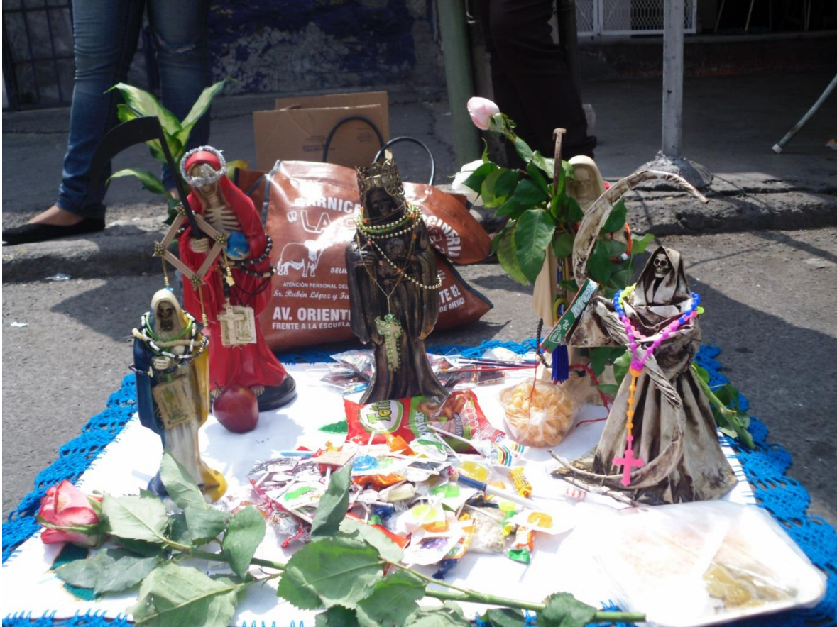
Imagen 7. Altar improvisado en la calle de Alfarería

Fuente: fotografía propia. 1 de agosto de 2013